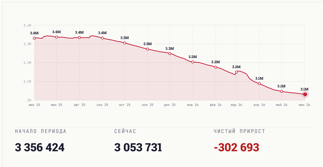
График роста подписчиков за год. На ключевых месяцах подписано точное число подписчиков. Видно, в какие месяцы канал прибавлял, а в какие подписчики уходили.